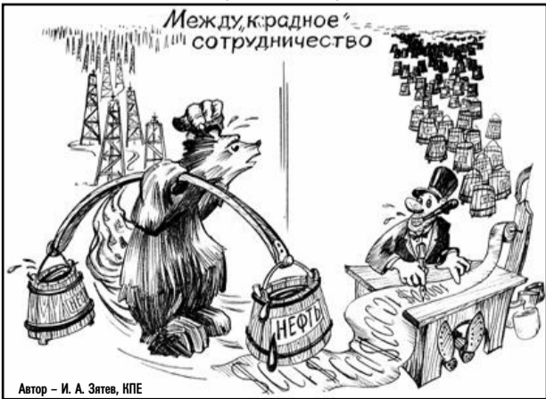
Автор - И. А. Зяев, КПЕ