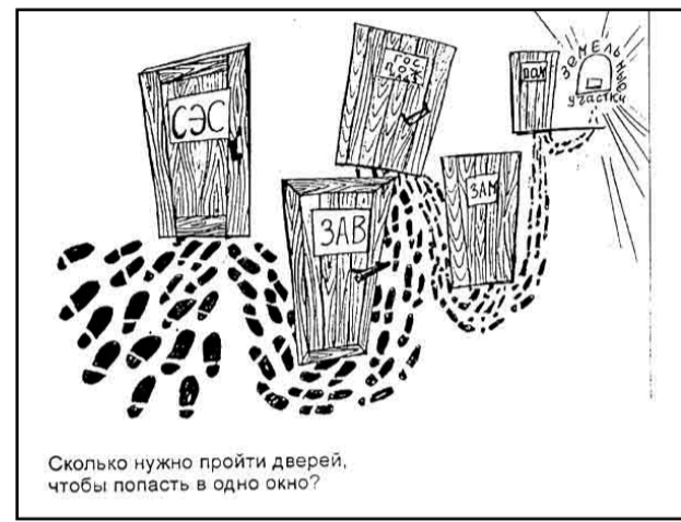
Сколько нужно пройти дверей, чтобы попасть в одно окно?