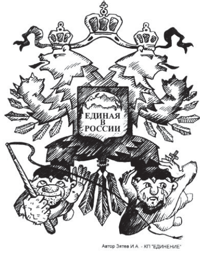
Автор Завья И.А. - КП «ЕДИНЕНИЕ»

По словам директора центра социально-консервативной политики «Урал», действующего при партии, Андрея Тиунова, производственный принцип партийного строительства